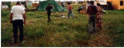
Asentamiento La Sarita. Junco-Especies Emergentes. Desplazamiento. 1995

Este proyecto dio lugar al nacimiento de una intención de rescate de largo plazo de remanentes de cultura local como vínculo para la recreación de redes, y a la iniciación de una serie de ejercicios interconectados en el estuario del Río de la Plata orientados a sostener sistemas socio/naturales amenazados. Cada uno de ellos estaba vinculado con la ecología cultural y bio/física del área en un formato de “activismo lento” que hilvanados crearon un “ensamblaje social” 14 , a través de una multiplicidad de ejercicios que entrelazados permiten redimensionar las posibilidades de intervención artística para explorar la posibilidad de desarrollo de ejercicios integrados en el territorio a escala bioregional. Estos ejercicios trataban problemas socioambientales, explorando modelos no-institucionales e interculturales en la esfera social. Interactuando, intercambiando experiencias y conocimientos con productores de cultura y cultivo, de arte y artesanías, de ideas y de objetos.