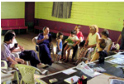
Ejercicio de Desplazamiento Río Santiago, 2002

Este proyecto dio lugar al nacimiento de una intención de rescate de largo plazo de remanentes de cultura local como vínculo para la recreación de redes, y a la iniciación de una serie de ejercicios interconectados en el estuario del Río de la Plata orientados a sostener sistemas socio/naturales amenazados. Cada uno de ellos estaba vinculado con la ecología cultural y bio/física del área en un formato de “activismo lento” que hilvanados crearon un “ensamblaje social” 14 , a través de una multiplicidad de ejercicios que entrelazados permiten redimensionar las posibilidades de intervención artística para explorar la posibilidad de desarrollo de ejercicios integrados en el territorio a escala bioregional. Estos ejercicios trataban problemas socioambientales, explorando modelos no-institucionales e interculturales en la esfera social. Interactuando, intercambiando experiencias y conocimientos con productores de cultura y cultivo, de arte y artesanías, de ideas y de objetos.