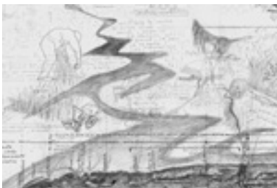
Derrame Shell 99. Cartografía Original emergente del relevamiento.

De esta manera la escultura se fue horizontalizando y desmaterializando, derramándose en investigaciones que contienen en su seno el menhir, la escultura, la arquitectura y el paisaje, “entendiendo por paisaje el acto de transformación simbólica y no solo física del espacio antrópico”, 16 escrutando el vacío de los no-lugares, las mutaciones urbanas, los ecosistemas, preguntando acerca de lo que los humanos somos capaces de construir o destruir, y para qué lo hacemos.