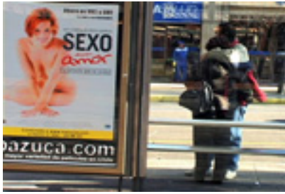
El Mapa Imposible Image: Diana Duhalde