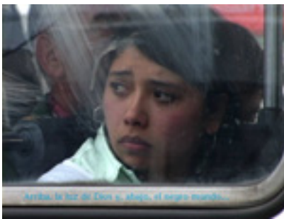
El Mapa Imposible Image: Diana Duhalde

La insegura conciencia de sí mismo, que frustra cualquier intento de acción o goce espontáneos, deriva en última instancia de la creencia desfalleciente en la realidad del mundo exterior, el cual ha perdido su inmediatez en una sociedad permeada por la 'información simbólicamente mediatizada'. Cuanto más se objetiva el individuo en su trabajo, más ilusoria es la apariencia de la realidad. Al volverse las operaciones de la economía y el orden social modernos cada vez más inaccesibles para la inteligencia cotidiana, el arte y la filosofía abdican de su tarea de explicarlos lo hacen en beneficio de las supuestamente objetivas ciencias sociales, las que a su vez han desechado el intento de aprehender la realidad para entretenerse en una clasificación de aspectos triviales (Lash 1999).