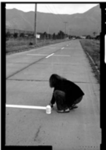
Lotty Rosenfeld, "Una milla de cruces sobre el pavimento". 1979.

La Escena de Avanzada, hecha de arte, de poesía y literatura, de escrituras críticas, se caracterizó por extremar su pregunta en torno a las condiciones límite de la práctica artística en el marco totalitario de una sociedad represiva; por apostar a la creatividad como fuerza disruptora del orden administrado que vigilaba la censura; por reformular el nexo entre “arte” y “política” fuera de toda dependencia ilustrativa al repertorio ideológico de la izquierda sin dejar, al mismo tiempo, de oponerse tajantemente al idealismo de lo estético como esfera desvinculada de lo social y exenta de responsabilidad crítica en la denuncia de los poderes establecidos.