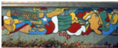
Brigada Ramona Parra, mural, Santiago de Chile.