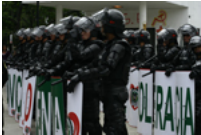
Military formation "Convivencia y Paz"

Los asistentes a la performance quedan en medio y otras veces atrapados, tanto por los militares como por los fisiculturistas. Desde un puente peatonal cercano, los ruidos del pesado tráfico se interrumpen a veces con arengas y gritos de dos estudiantes, que enfurecidos gritan '¡Cerdos policías! ¡Asesinos!'.